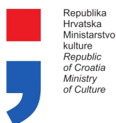
Republika Hrvatska Ministarstvo kulture Republic of Croatia Ministry of Culture